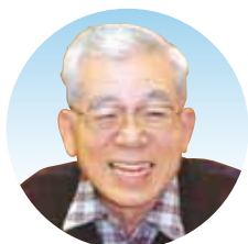
児童文学者 那須 正幹